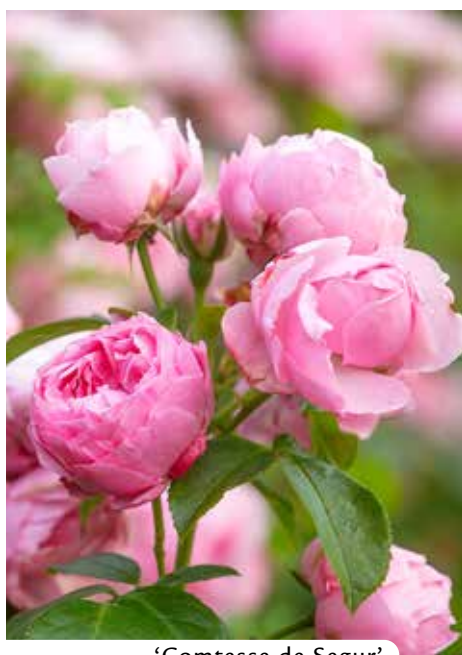
'Comtesse de Segur'